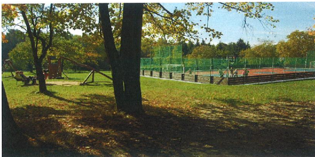
Multifunkční hřiště léčebny.

Nedílnou součástí pobytu dětí jsou také divadelní představení nebo koncerty. Samotné děti se také podílejí na různých vystoupeních, která jsou oblíbená nejen u rodičů, ale i u zaměstnanců léčebny. Pravidelná jsou dětská představení na závěr školního roku či o Vánocích.