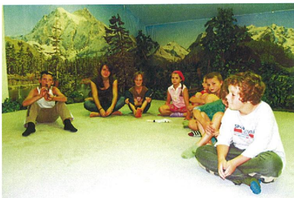
Relaxační místnost a bazén vodoléčby.

Za pozitivními léčebnými výsledky se dále v nemalé míře podepsala možnost cvičení ve fitness centru léčebny, jízdy na kolech v areálu i mimo něj, procházky a hry v lesích okolo léčebny, pravidelné plavání v bazénu Opengate v Babicích či bohatý program plný nejrůznějších výletů.