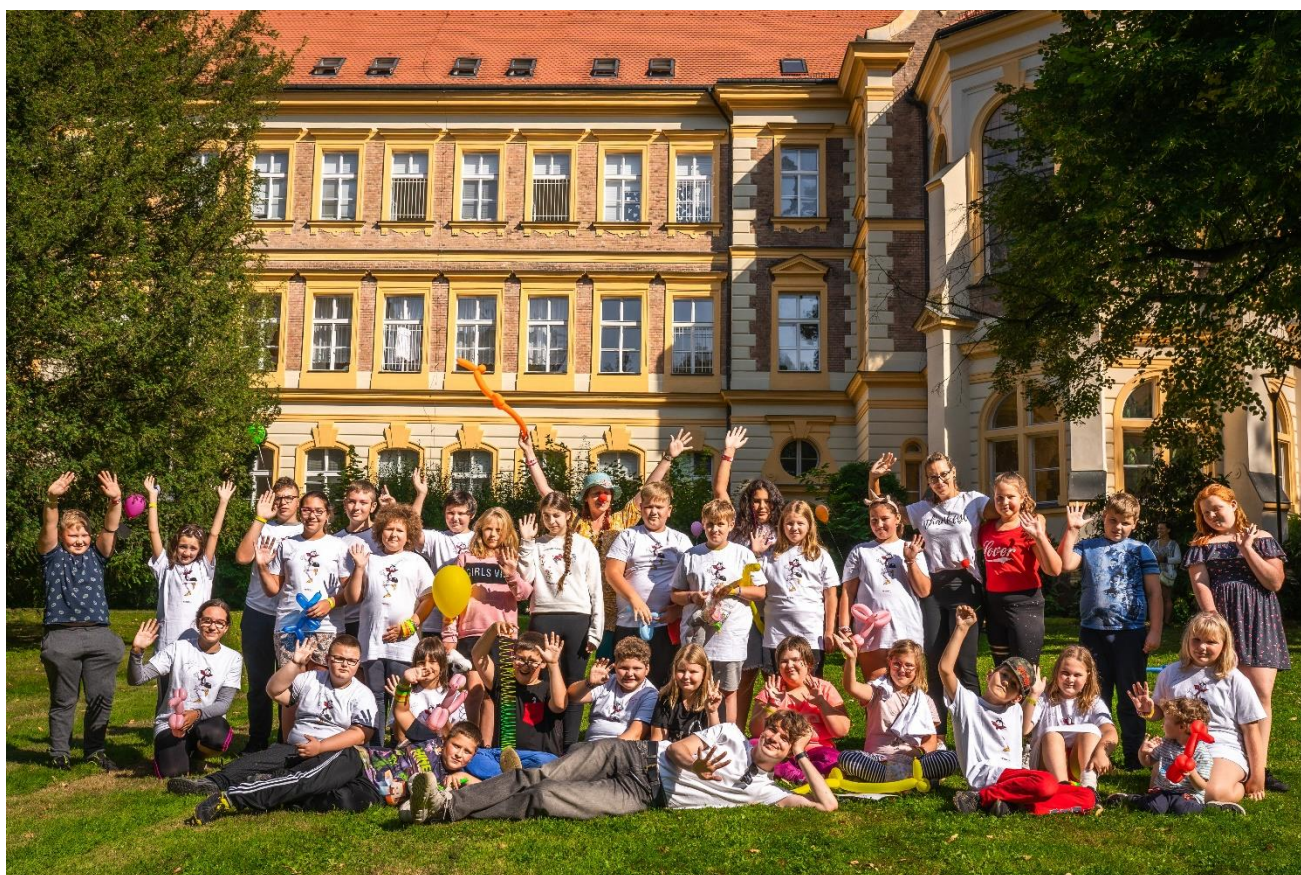
Obrázek 6: Setkání dětí v areálu

V souladu se zákonem č. 248/1995 Sb., o obecně prospěšných společnostech bude Výroční zpráva Olivovy dětské léčebny, o.p.s. po schválení Správní radou veřejně přístupná na www.olivovna.cz a přiložena k dokumentaci vedené u rejstříkového soudu o.p.s.