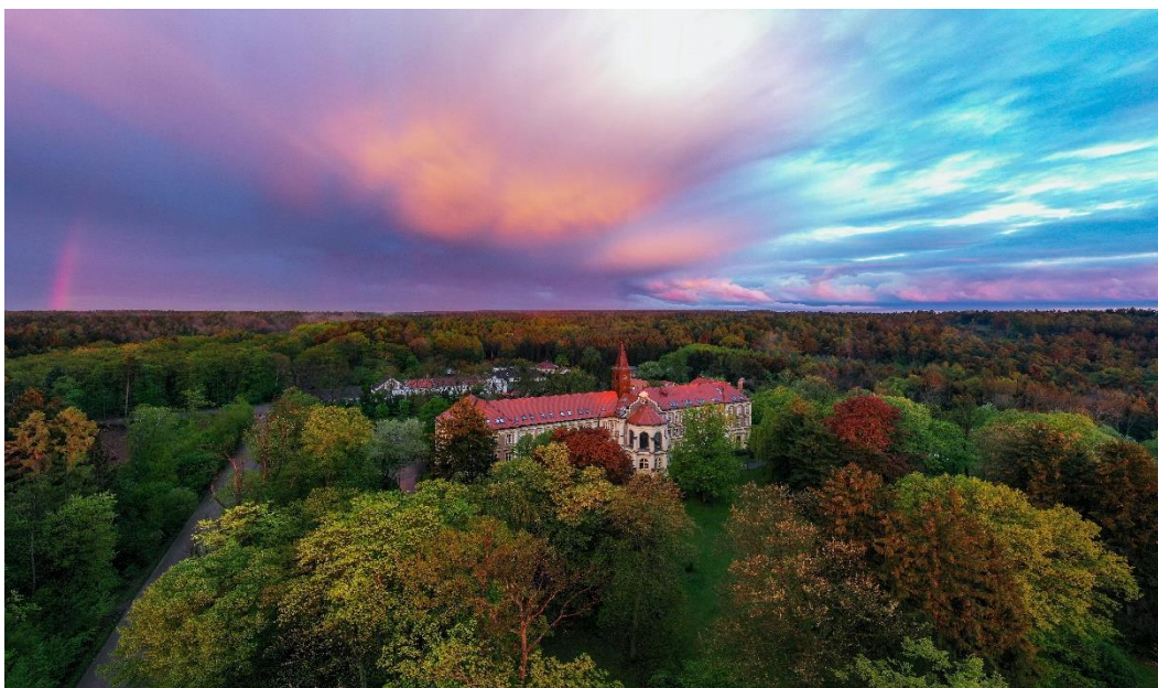
Obrázek 1: Olivova dětská léčebna

Název: Olivova dětská léčebna, o.p.s. Sídlo: Olivova 224, Říčany, 251 01 IČ: 256 89 371 DIČ: CZ25689371 Vznik: 14. 8. 1998 Zapsáno: Městský soud v Praze, oddíl O, vložky 53 Webové stránky: www.olivovna.cz Datová schránka: s5zncbg