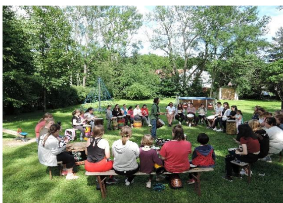
Obrázek 3: Společné bubnování

Po každodenním ukončení procedur je pro děti připraven kvalifikovanými vychovateli odpolední program. Jedná se o vyrábění různých předmětů, karnevaly, diskotéky, jízda na koloběžkách, chůze s nordic walking holemi, procházky a hry v lesích okolo léčebny, pravidelné plavání v bazénu v nedalekých Babicích, návštěvy kina, herní terapie, ergoterapie