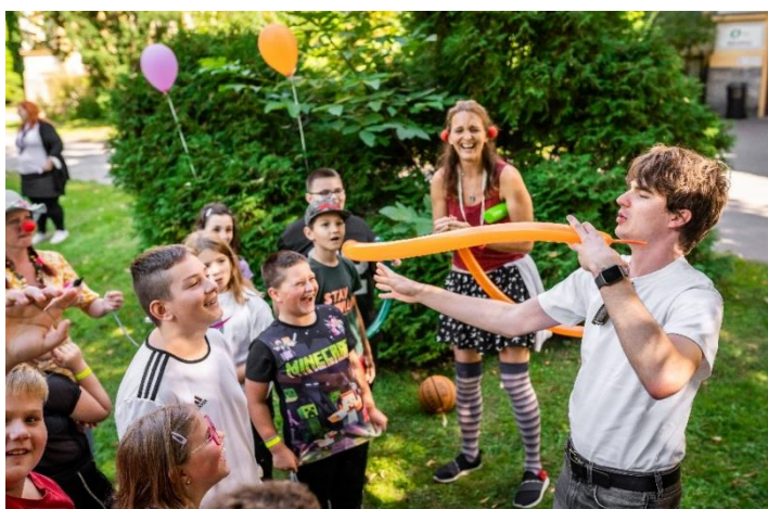
Obrázek 4: Setkání s youtuberem Kovym

I v roce 2021 byly aktivity zaměřené na kulturní, společenské a sportovní akce značně omezené pandemií COVID – 19. Přes zimní a podzimní měsíce byl veškerý program externích osob zrušen z důvodu bezpečnosti našich pacientů (divadélka, koncerty apod.). V letních měsících jsme aktivity plánovali ve venkovních prostorech a dbali na zvýšené hygienické podmínky. Zúčastnili jsme se akce s naším zřizovatelem Městem Říčany při pořádání dne dětí a přivítali jsme