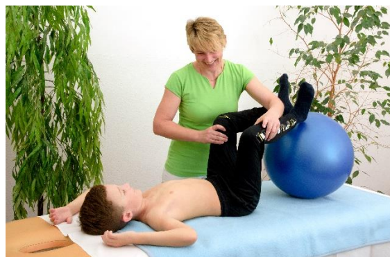
Obrázek 2: Ambulance fyzioterapie

Všechny služby v ambulancích jsou hrazeny z veřejného zdravotního pojištění.